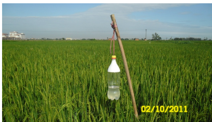
Hình 1. Bẫy chai và cách cắm bẫy trên ruộng

Theo dõi thí nghiệm: Hàng ngày đếm số lượng trưởng thành vào từng bẫy và loại bỏ. Bổ sung nước vào bẫy chai cho đạt độ sâu 4-5 cm. Điều tra mật độ sâu theo Quy chuẩn kỹ thuật quốc gia về phương pháp điều tra phát hiện dịch hại cây trồng, 2010.